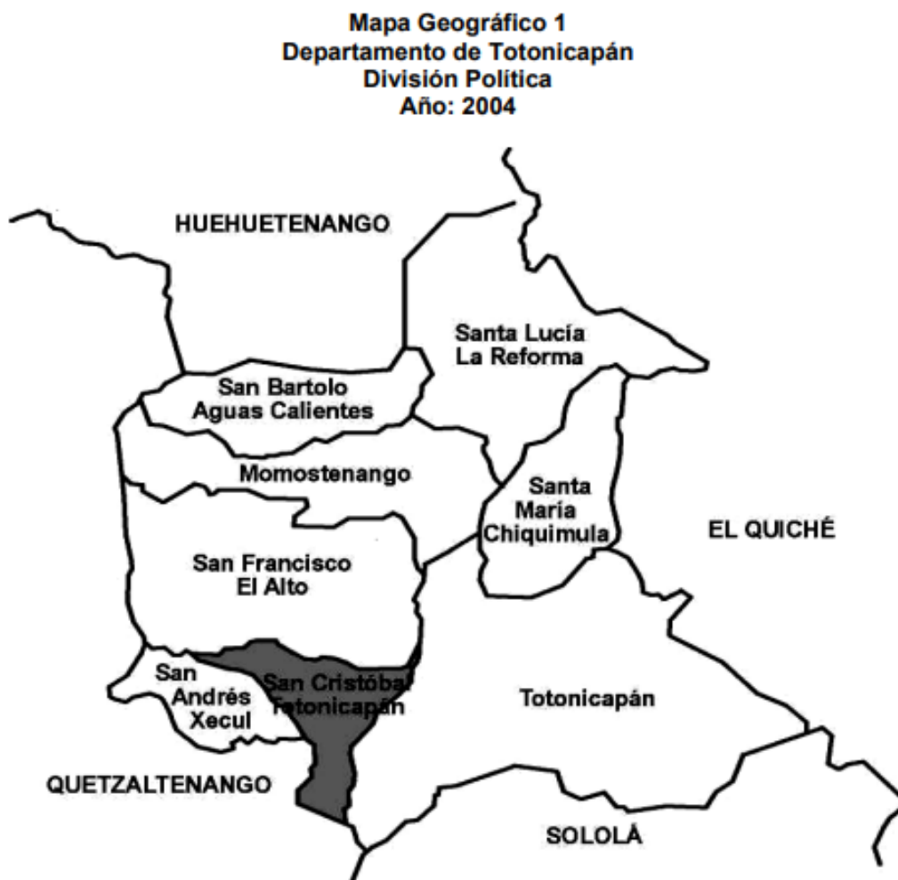
Imagen No. 2. Ubicación del municipio de San Cristóbal Totonicapán.